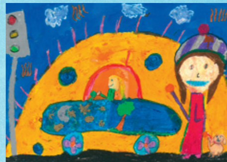
Kayra Van der Kley Zyklus 2 Cycle 2