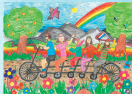
Leni Schneider Zyklus 3 Cycle 3