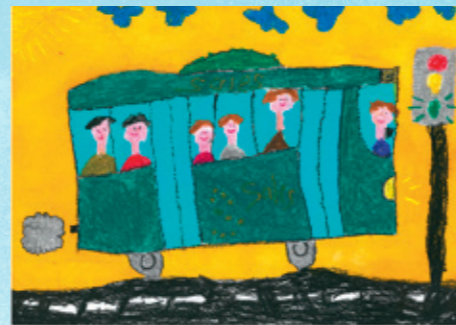
Pit Schmitz Zyklus 1 Cycle 1